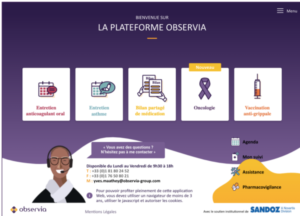
Figure 1 - Solution Observia pour accompagner les patients atteints de pathologies chroniques