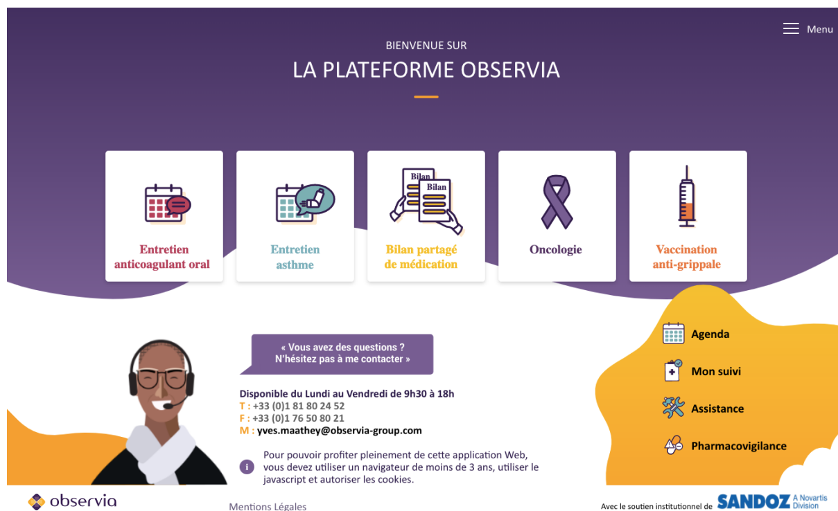
Figure 1 - Plateforme Observia pour accompagner les patients atteints de pathologies chroniques

afin de lutter contre le risque de iatrogénie (ensemble des effets indésirables provoqués par la prise d'un ou plusieurs médicaments) et favoriser leur bonne observance médicamenteuse. En effet, la iatrogénie serait responsable de 3,4% des hospitalisations et d'environ 7 500 décès par an chez les patients âgés de 65 ans et plus en France 5 . 3,9 millions d'individus sont par ailleurs considérés comme particulièrement exposés aux risques liés à la polymédication 3 .