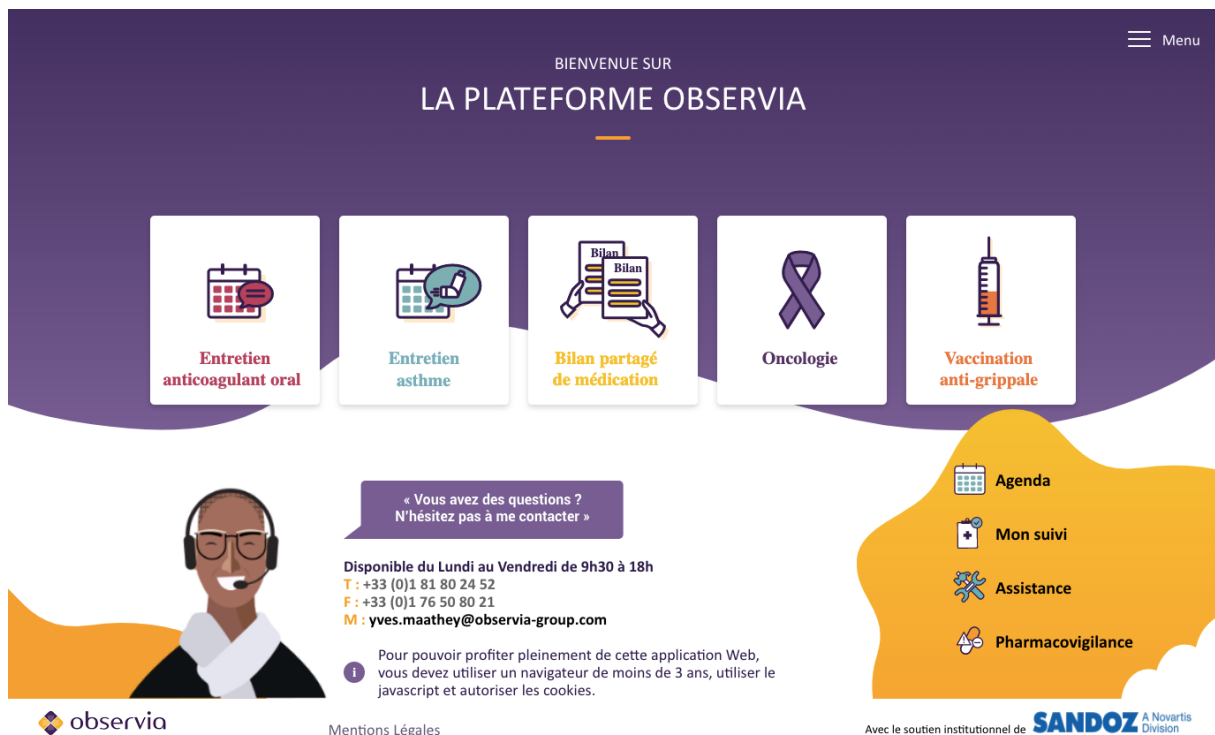
Figure 1 - Plateforme Observia pour accompagner les patients atteints de pathologies chroniques

serait responsable de 3,4% des hospitalisations et d'environ 7 500 décès par an chez les patients âgés de 65 ans et plus en France 5 . 3,9 millions d'individus sont par ailleurs considérés comme particulièrement exposés aux risques liés à la polymédication 3 .