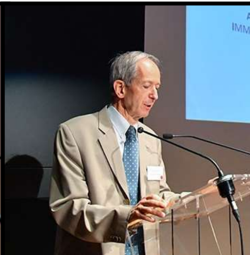
PROJET ASIL Denis SERRUQUES, France Terre d'Asile

Programme d'expérimentation de la prise en charge structurée de la santé de 1000 enfants placés avant l'âge de 5 ans à l'Aide Sociale à l'Enfance.