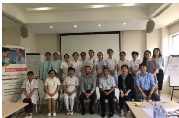
Workshop organisé par Observia dans un hôpital chinois

La société Observia est heureuse d'annoncer l'ouverture d'une filiale régionale à Shanghai et son développement sur le continent asiatique.