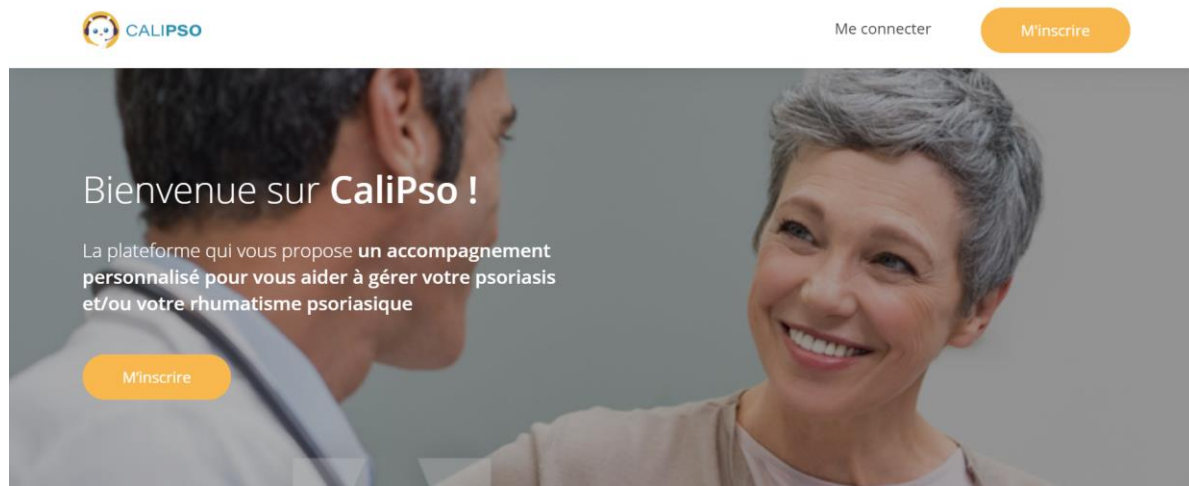
Figure 1 : Page d'accueil de CaliPso

Le projet a été développé par la société Observia et bénéficie du soutien institutionnel du laboratoire Lilly France. Il répond à de nombreux besoins identifiés lors d'une enquête réalisée pour le projet dès 2016 auprès de 28 professionnels de santé (dont 20 dermatologues) et 12 patients atteints de psoriasis et de rhumatisme psoriasique.