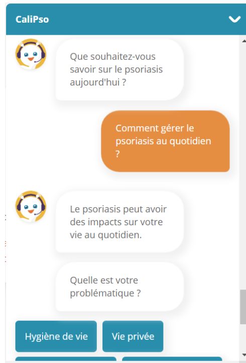
Figure 2 : Exemple du chatbot CaliPso

« Nous avons pensé CaliPso comme un outil facile à prendre en main par tous les patients. Il propose aux patients les bonnes informations au bon moment et c'est un bon intermédiaire et facilitateur de la relation patient/médecin. Nous avons ouvert CaliPso à tous car nous le conseillons à toutes les personnes atteintes de psoriasis et/ou de rhumatisme psoriasique. »